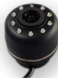
車内用追加カメラ