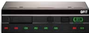
【GFIT本体：FD-1000】装置指定番号：自 TD2-39